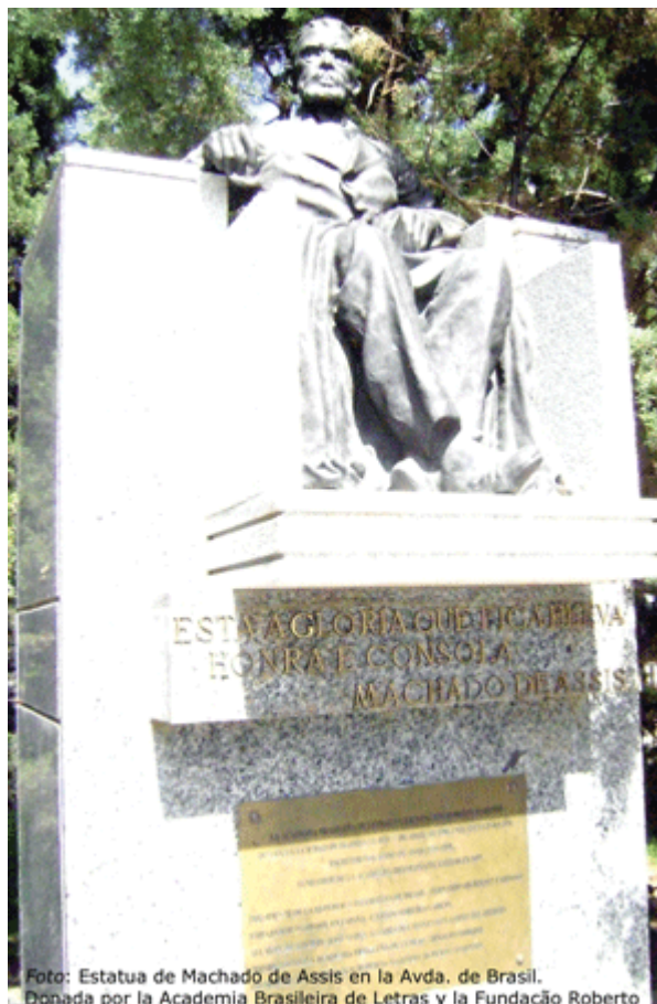
Foto: Estatua de Machado de Assis en la Avda. de Brasil. Donada por la Academia Brasileira de Letras y la Fundação Roberto Marinho en abril de 1998 a la Comunidad de Madrid.